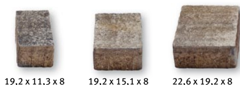
19,2 x 11,3 x 8 19,2 x 15,1 x 8 22,6 x 19,2 x 8