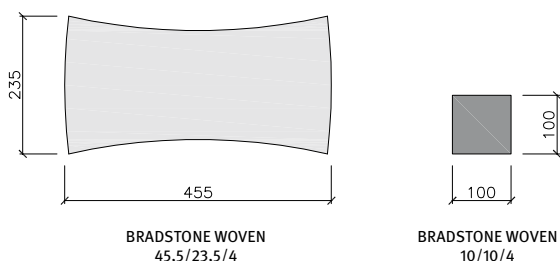
BRADSTONE WOVEN 45,5/23,5/4