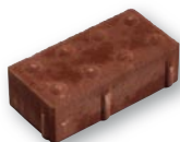
10 x 20 x 6(8)