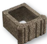
31 x 33 x 19