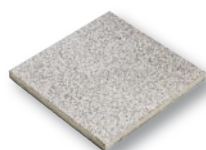
40,5 x 40,5 x 3,8