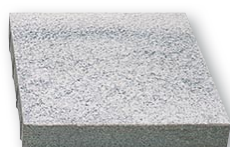
50 x 50 x 8